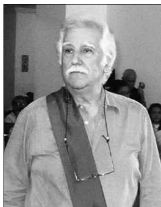
En la recepción de la Orden Guariarepano 2010, Concejo Municipal Bolivariano Libertador