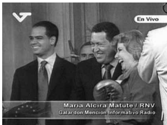
con Hugo Chávez Frías, presidente de la República y Andrés Izarra en la entrega del Premio Nacional de Periodismo, Miraflores, Caracas