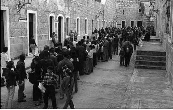
Feria del Libro de Cuba, La Habana