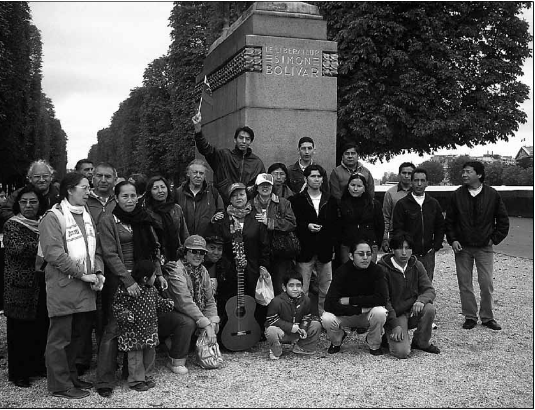
Ofrenda floral ante monumento de Bolívar, organizada por el Comité Bolivariano Artiguista de Venezuela, LLM, Círculo Bolivariano de París y Comité ALBA Francia, y grabación de programa especial, París