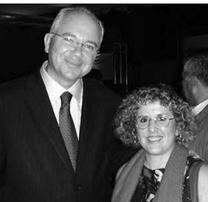
con Rafael Ramírez, en el 7º Aniversario de PDVSA La Estancia, Caracas