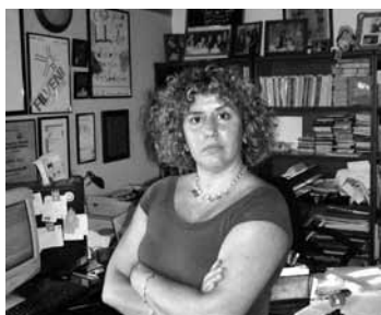
En su biblioteca particular