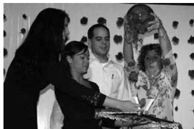
con Andrés Izarra, en la presentación del libro Encuentro latinoamericano vs. terrorismo mediático , Fundación Centro de Estudios Latinoamericanos Rómulo Gallegos (CELARG), Caracas