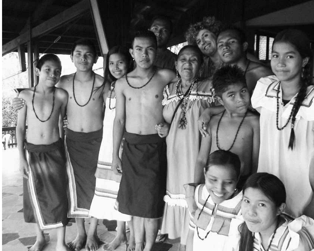
Grabación de programa especial, en Ciudad Bolívar