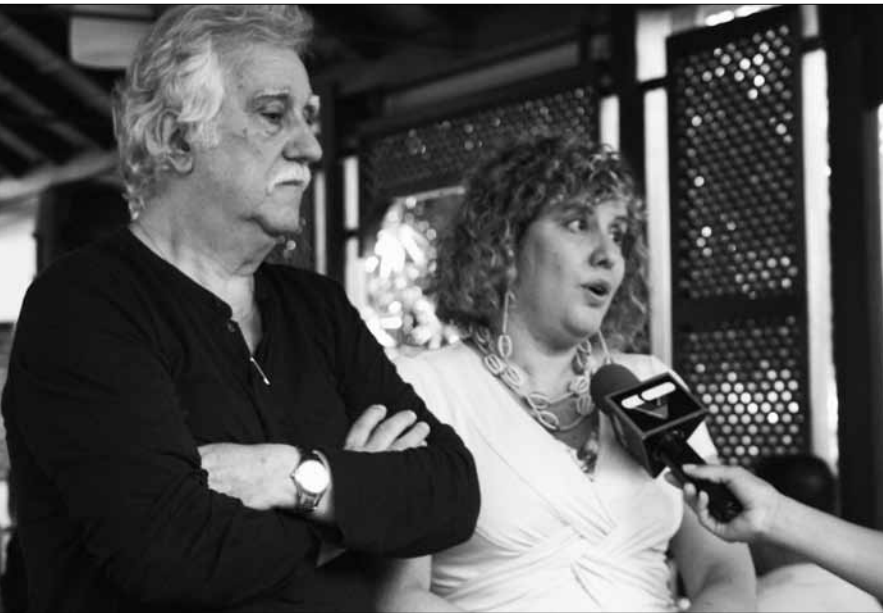
Entrevista para el Noticiero de VTV, 5.º aniversario de LLM televisiva, PDVSA La Estancia