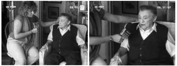
Entrevista a Mario Benedetti, en Montevideo, Uruguay.