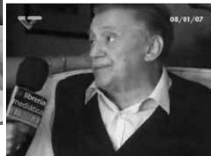
FILVEN 2007, Parque Generalísimo Francisco de Miranda