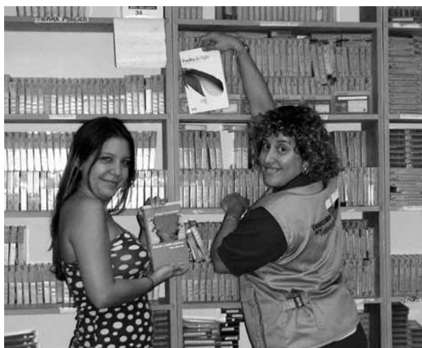
con Laura García.