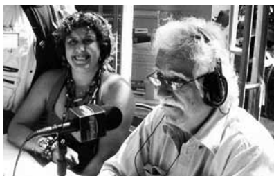
En la transmisión en vivo de El picadillo del domingo , desde el Encuentro latinoamericano vs. terrorismo mediático, CELARG, Caracas